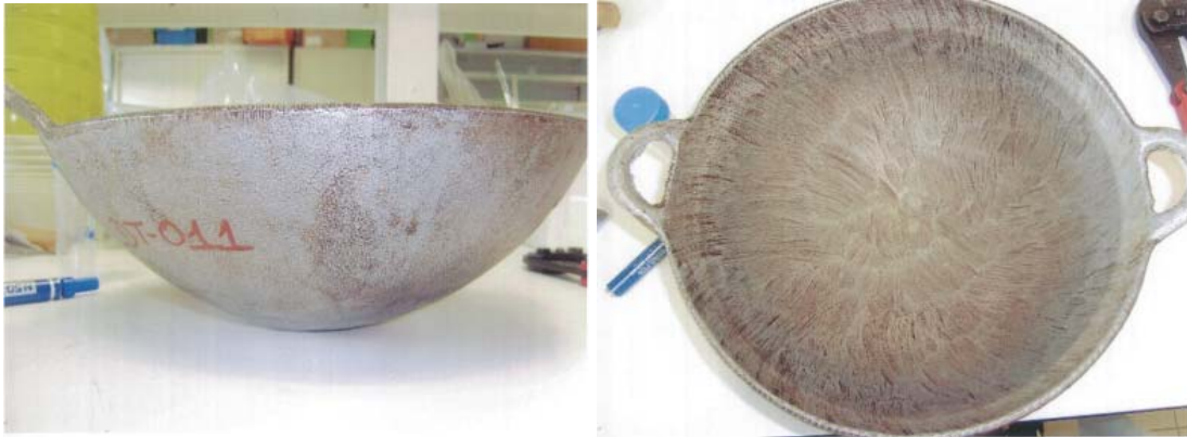
Figure 2 : exemple de marmite retrouvée dans un foyer de Charvein

Dans une étude sur ce type d'ustensiles, Weidenhamer et al. ont mesuré des teneurs en plomb dans les alliages supérieurs à 100 \text{ mg kg}^{-1} et des concentrations de 70 \text{ } \mu\text{g L}^{-1} à 866 \text{ } \mu\text{g L}^{-1} ont été rencontrées lors d'essais de libération avec un simulant acide (acide acétique à 4%) mis en contact 2 heures à ébullition (Weidenhamer et al. 2014).