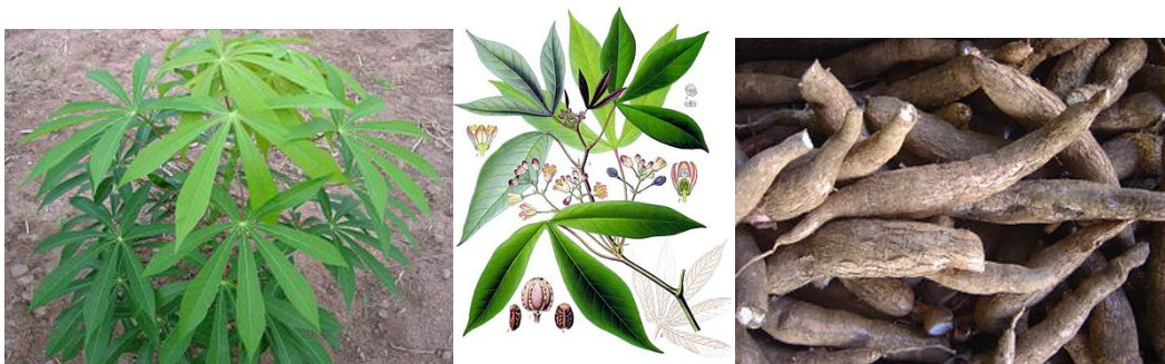
Figure 3 : Feuilles et racines de Manihot esculenta

Le manioc ( Manihot esculenta ) est un arbuste vivace de la famille des Euphorbiacées, originaire du nord-ouest du Brésil et d'Amérique centrale et qui peut atteindre deux mètres de haut. Il est aujourd'hui largement cultivé et récolté comme plante annuelle dans les régions tropicales et subtropicales. Sa reproduction est relativement facile par bouturage. La récolte arrive au bout de 7 mois, puis au bout de 18 mois. Ce sont ses racines tubéreuses (tubercules) qui sont le plus utilisées pour l'alimentation, même si ses feuilles sont aussi consommées en Afrique, en Asie et dans le nord du Brésil (pour la confection du maniçoba).